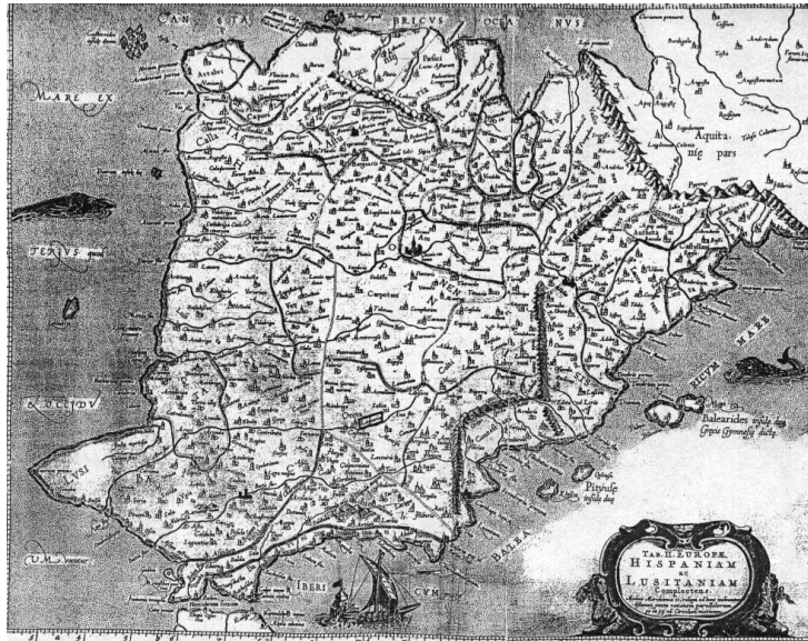
Mapa de España de Tolomeo