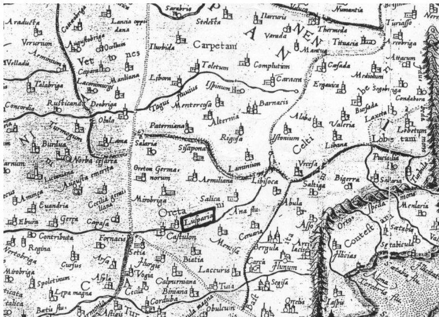
Fragmento ampliado del mapa anterior