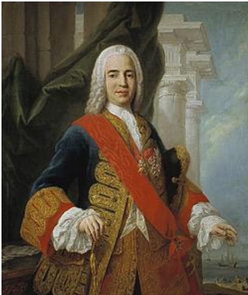
MARQUÉS DE ENSENADA

Se personaron en Lupión las autoridades encargadas de hacer un censo de todos los recursos del Lugar (materiales y humanos). Este censo fue mandado hacer por el entonces ministro de Hacienda: El Marqués de la Ensenada; se realizó en gran parte de España y su objetivo era recaudar contribución por todos los bienes.