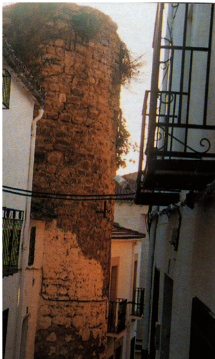
Torreón del Castillo.