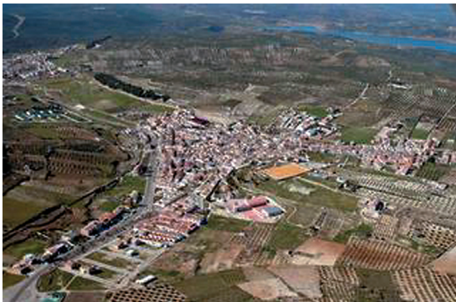
Vista aérea de Rus.