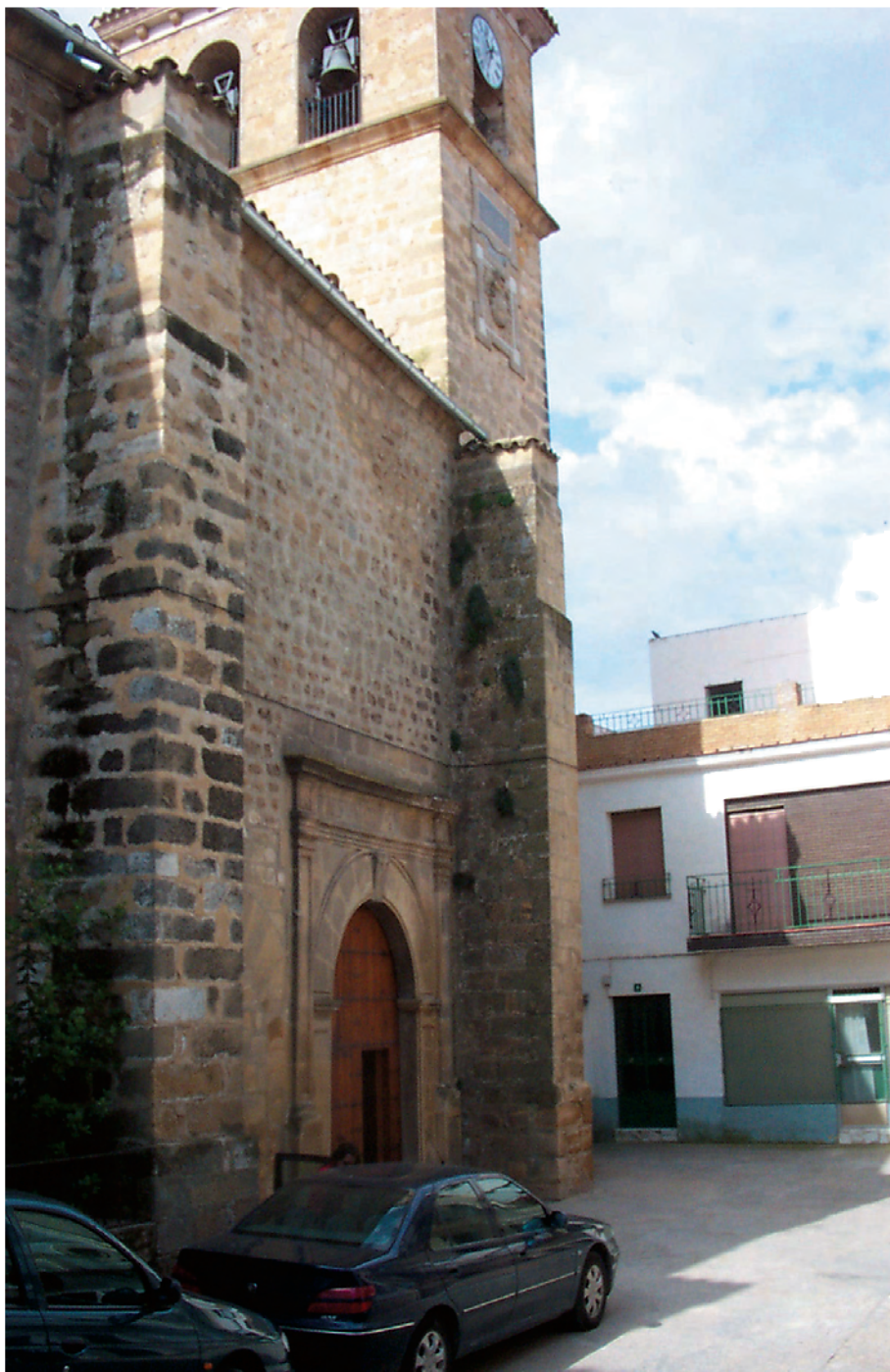
Iglesia parroquial de la Asunción.