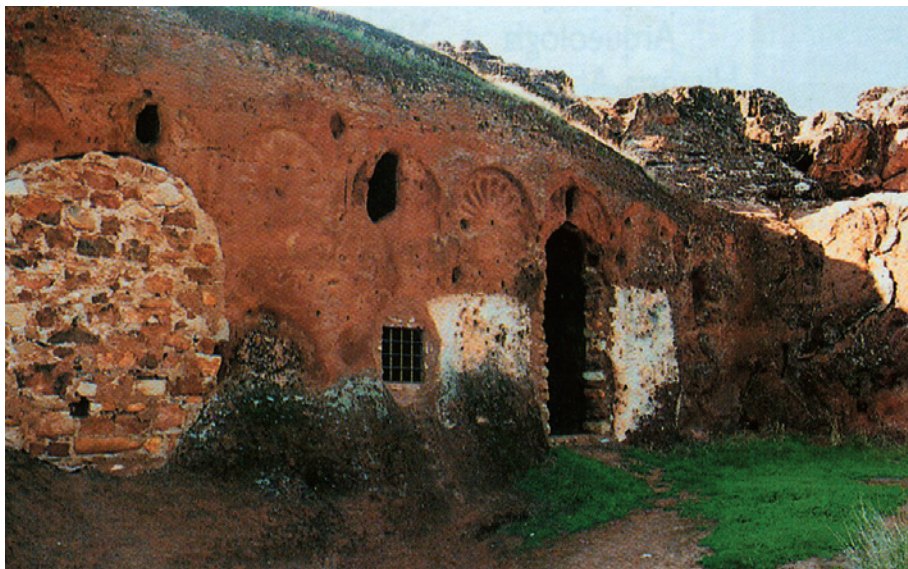
Monasterio rupestre de Valdecañales.