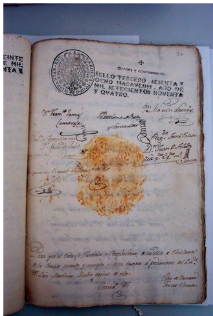
Libro de Actas.

y cultural de los municipios. Aunque no siempre se le ha prestado la atención y el cuidado que merecen. En nuestro caso y desde que tenemos noticias, el ayuntamiento de Chiclana estaba situado en la actual Plaza del Generalísimo pero no albergaba al archivo sino que éste se localizaba fuera del mismo, en lo que era el antiguo edificio del Pósito. Este inmueble además de servir para el archivo se utilizaba también para uso de otros organismos como la Cámara Agraria, El Juzgado de Paz, el Consultorio Médico, etc.