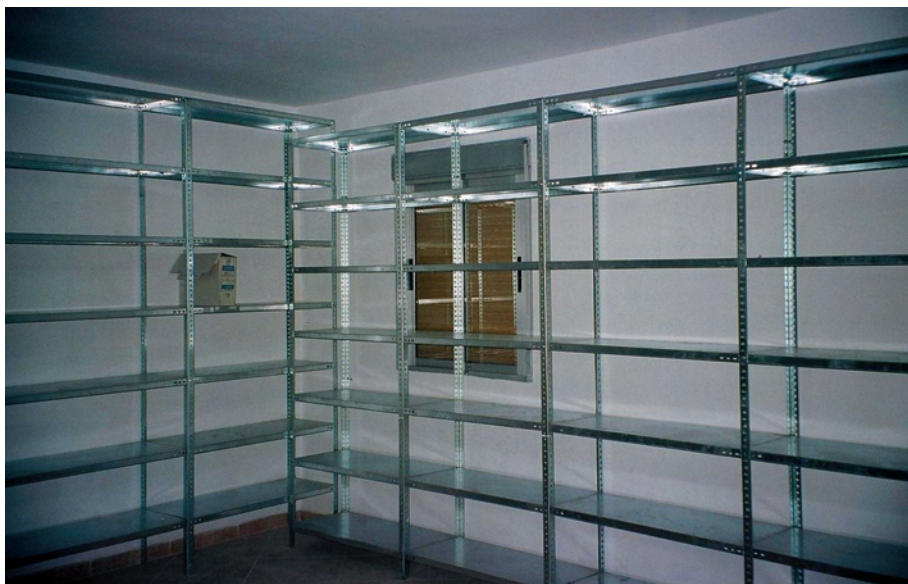
Instalaciones de Chiclana.

de las restricciones que, por razón de la conservación de los bienes custodiados o de la función propia de la institución puedan establecerse. En su art. 57.1 regula el libre acceso, limitándolo a la concesión de una autorización si afecta a materias clasificadas o a la seguridad del Estado, también en el caso de que contengan datos personales referidos a la seguridad e intimidad de las personas.