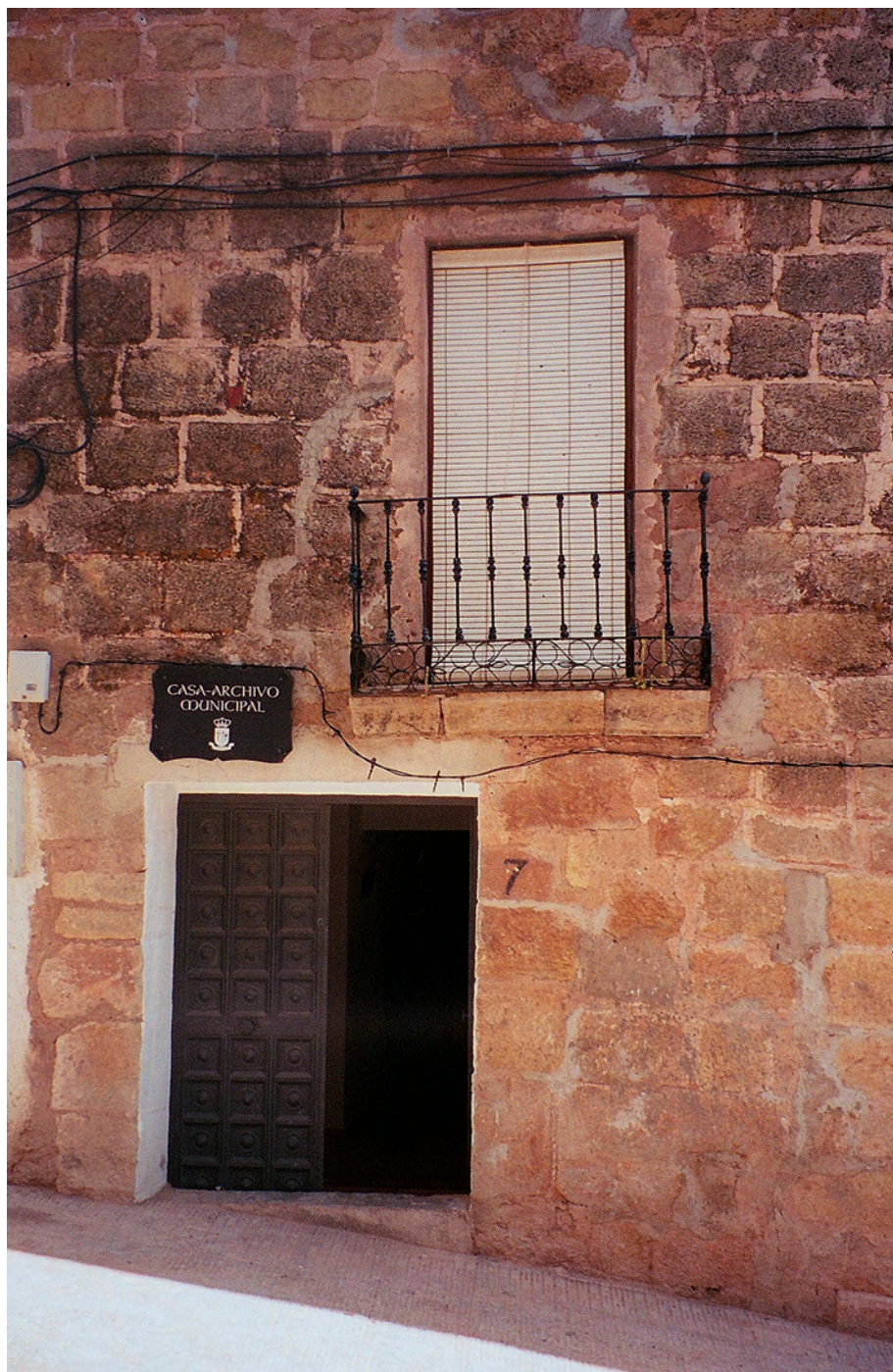
Casa Archivo Municipal.