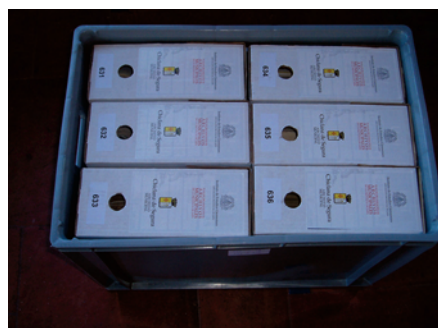
Cajas enbaladas para su devolución a Chiclana de Segura.

-Ley 3/1984 autonómica de Archivos de Andalucía y el Decreto 97/2000, donde se aprueba el Reglamento del Sistema Andaluz de Archivos, donde la Sección 1. a desarrolla