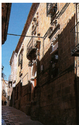
Casa de la Encomienda.