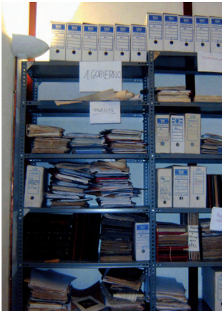
Proceso de ordenación.

En mayo del 2003 el equipo de trabajo se trasladó a Chiclana, previo estudio de su situación, para embalar todo el archivo, excepto la documentación de oficina del último año y los libros de actas de las Sesiones del Pleno. Una vez en Jaén comenzaron los trabajos de organización. Mientras tanto, en Chiclana se realizaban