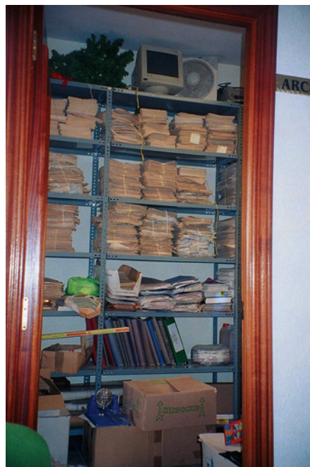
Situación previa a la organización.

La reforma impuesta por Carlos III, en 1766, en lo referente al régimen municipal creará dos nuevas instituciones: los Diputados del Común, destinados a intervenir en la fiscalización en materia de abastos y el Síndico, como una especie de abogado de la ciudad.