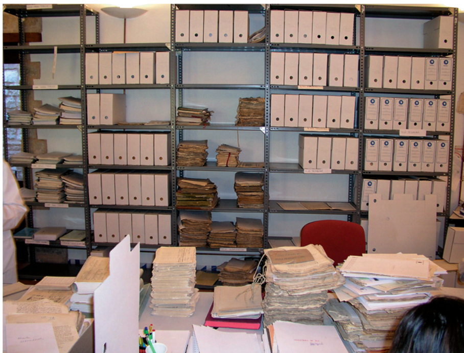
Proceso de ordenación.

algunas obras de adecuación como: poner las estanterías metálicas con las dimensiones normalizadas, pintar, retirar todos los trastos y muebles que compartían habitación con la documentación etc. Además se establecieron las medidas de seguridad oportunas (extintores, puerta ignífuga, etc.).