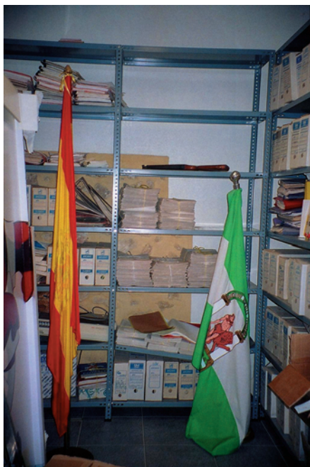
Situación previa a la organización.

gidor, el cual era designado por el monarca en todos los municipios y localidades desde la Pragmática Real de 1500, años más tarde acabará cediendo terreno a los Intendentes de Provincia, los cuales mantendrán su función en el ámbito local hasta la creación del municipio constitucional.