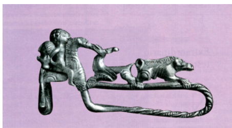
Fíbula de plata ibera procedente del tesoro de «Los Engarbos».