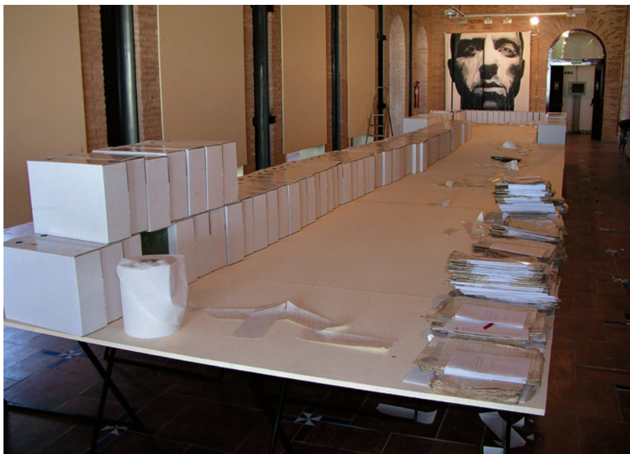
Sala de trabajo en el I.E.G.

Municipales 12 , el cual está dividido en cuatro secciones que corresponden a Gobierno, Administración, Servicios y Hacienda. En cada sección, y con otro dígito añadido están las subsecciones y dentro de éstas las series documentales: