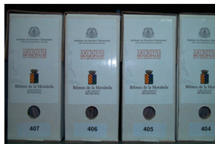
Detalle de las cajas del Archivo.

- Ley 30/1992 de Régimen Jurídico de las Administraciones Públicas y del Procedimiento Administrativo Común art. 35: promulga el derecho del ciudadano a conocer en cualquier momento el estado de la tramitación de los procedimientos en los que tengan la condición de interesados . También res-