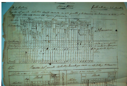
Registro del ganado caballar de 1837.

Archivo (2.07): encontramos inventarios de los años 70.