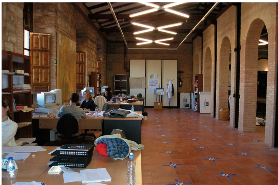
Unidad de patrimonio documental del I.E.G.

ramentales eficaces para garantizar el cumplimiento de los objetivos de gobierno afectando a todos los organismos municipales. Está dividida en ocho subsecciones: Secretaría, Registro, Patrimonio, Personal, Servicios Jurídicos, Contratación y Archivo.