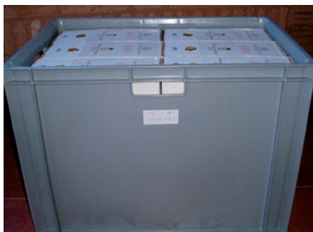
Mudanza mediante cajas adecuadas.

de la documentación al Ayuntamiento de Bélmez de la Moraleda. Una vez allí se instaló en los ordenadores el programa informático, agilizando sin duda la labor administrativa, además de facilitar el acceso y consulta a los ciudadanos, o investigadores que lo requiriesen.