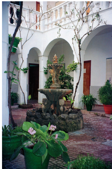
Patio interior del Ayuntamiento.

GISTRO CIVIL, JUICIOS Y JURISDICCIÓN VOLUNTARIA.