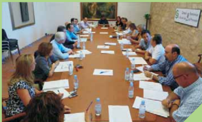
Pleno extraordinario de 14 de julio de 2011.

Los estudios, informes y resoluciones emitidos por el Consejo Económico y Social de la provincia de Jaén no tendrán carácter vinculante.