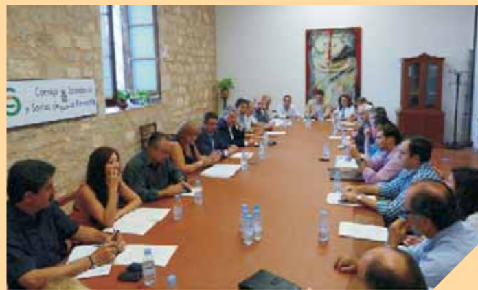
Pleno extraordinario de 20 de septiembre de 2011.