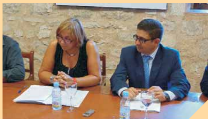
Pleno extraordinario de 9 de noviembre de 2011.

http://www.dipujaen.es/conoce-diputacion/areas-organismos-empresas/cesjaen/index.html