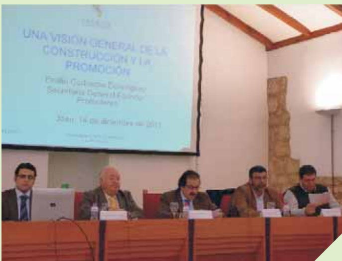
Ponentes de la Mesa Redonda titulada " El momento actual del sector de la construcción en la provincia de Jaén. El subsector de la Vivienda".