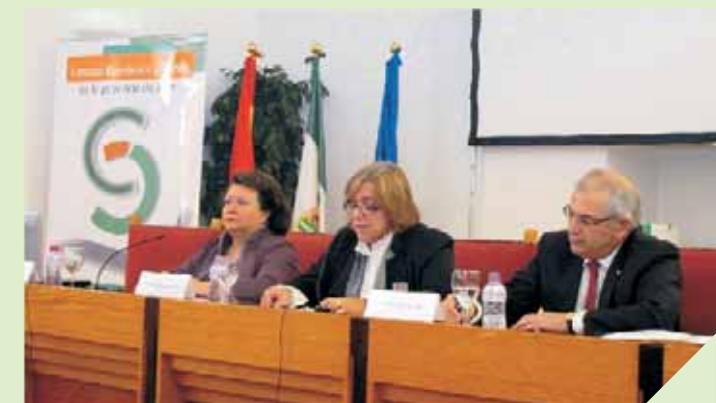
Ponentes en la inauguración de las Jornadas sobre la situación socioeconómica y laboral de la provincia de Jaén.

Como todos los años, el Consejo Económico y Social de la provincia de Jaén en colaboración de la Universidad de Jaén organizó el pasado 14 de diciembre, las Jornadas sobre la situación socioeconómica y laboral de la provincia, que sirvieron de foro para profundizar y discutir sobre temas de interés para la misma; en esta ocasión se pretendió analizar el momento actual del sector de la vivienda y los nuevos retos de la economía social y el cooperativismo en nuestra provincia.