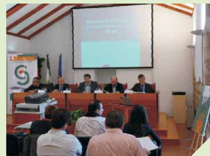
Ponentes de la Mesa Redonda " Nuevos retos de la economía social y el cooperativismo en la provincia de Jaén".

La elaboración del trabajo ha contado con las aportaciones de las Instituciones, Organizaciones y expertos/as de las distintas comisiones de trabajo, así como con la de la Comisión Permanente del CES provincial, a las que se han sumado los estudios y análisis concertados con equipos de colaboradores y colaboradoras externos para determinados capítulos, como Turismo, Población y Flujos migratorios, Cultura y Deporte, Sanidad, Justicia y Energía.