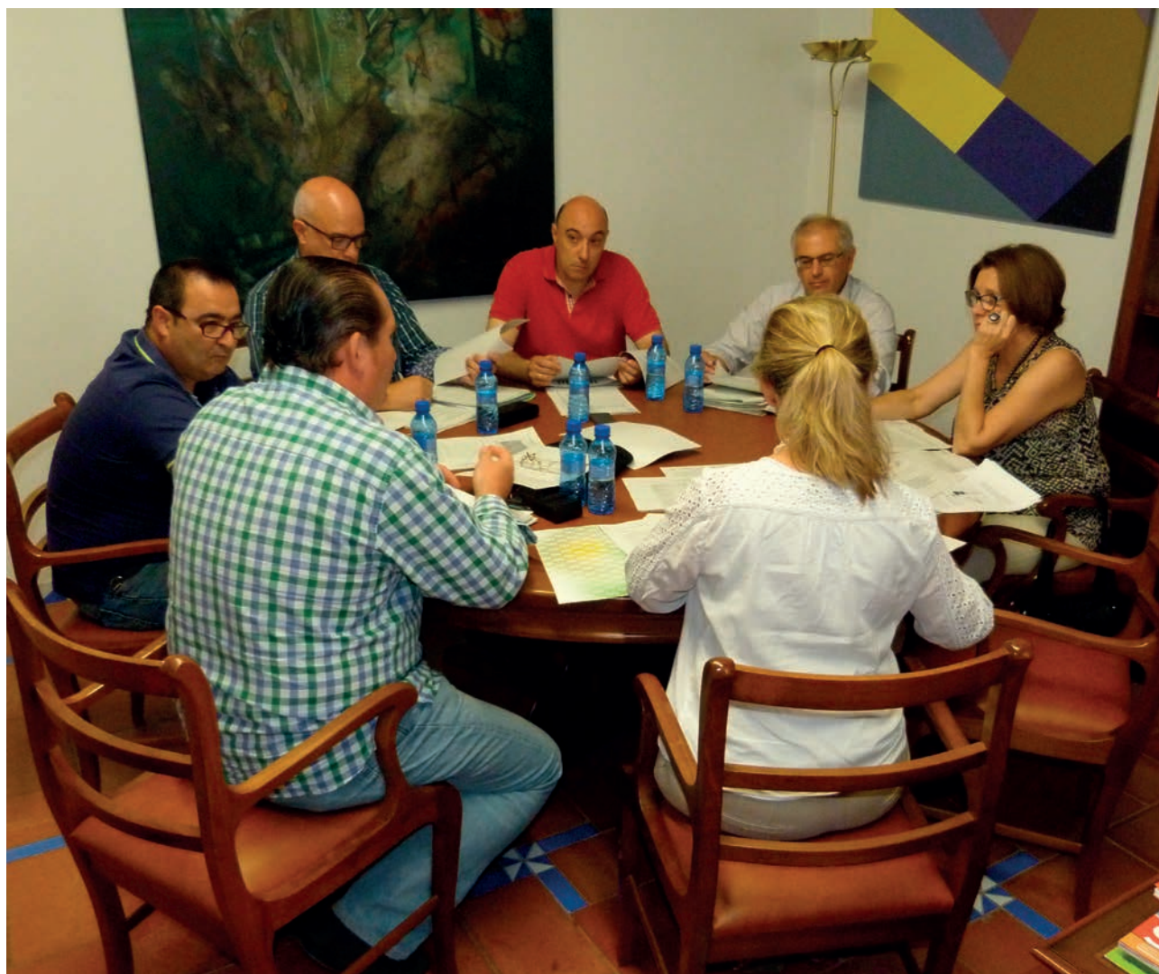
Comisión de Agricultura del 24 de junio de 2015