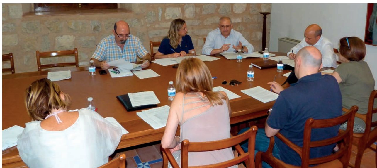
Comisión de Economía del 29 de junio de 2015