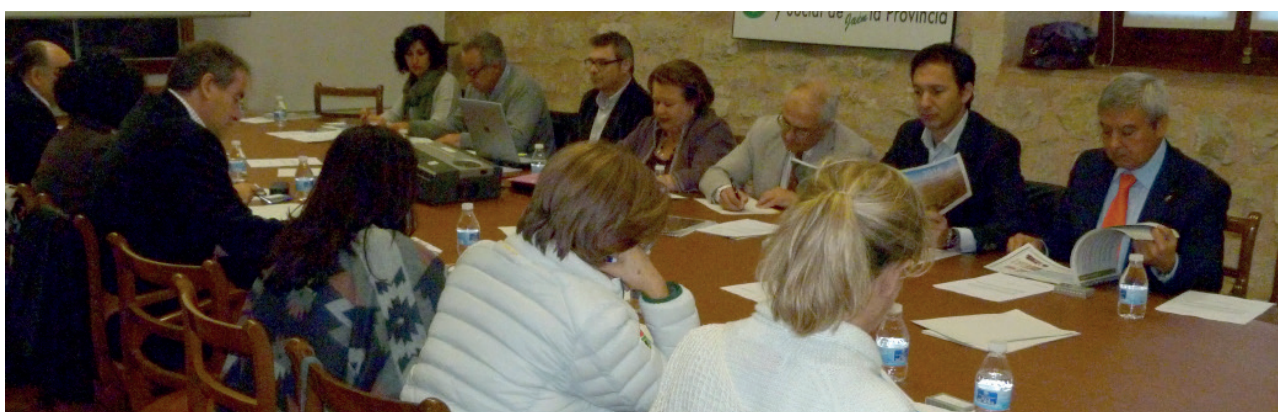
Pleno del 23 de noviembre de 2015