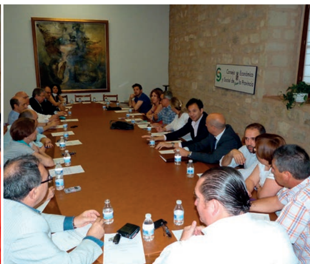
Pleno del 18 de mayo de 2015