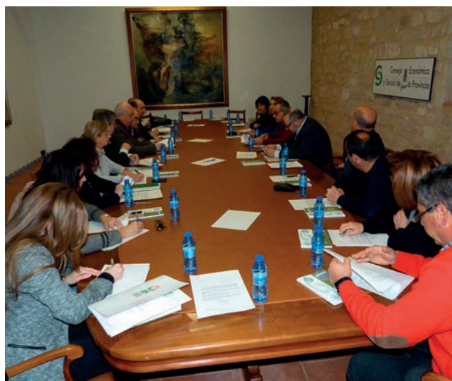
Pleno del 17 de marzo de 2015