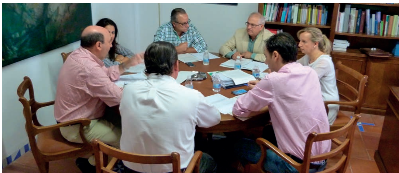
Comisión Permanente del 29 de septiembre de 2015