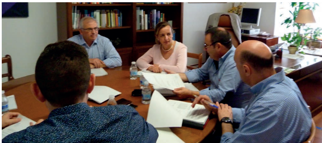
Comisión de Relaciones Laborales y Empleo del 16 de junio de 2015