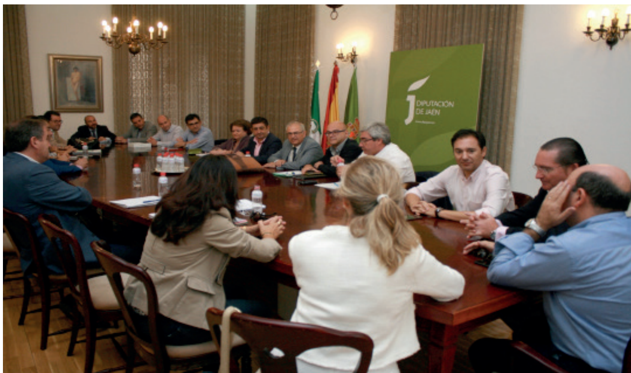
Reunión con los Diputados/as del Grupo Socialista de la Diputación Provincial de Jaén y la Comisión Permanente del CES el día 9 de octubre de 2015

El Presidente del CES provincial hizo entrega a los Diputados/as de la Memoria correspondiente al año 2013, ya que la de 2014 estaba pendiente de su publicación durante el mes de diciembre. Los Diputados/as y los miembros de la Comisión Permanente coincidieron en que el reto fundamental que tiene por delante la provincia es reducir la elevada tasa de desempleo.