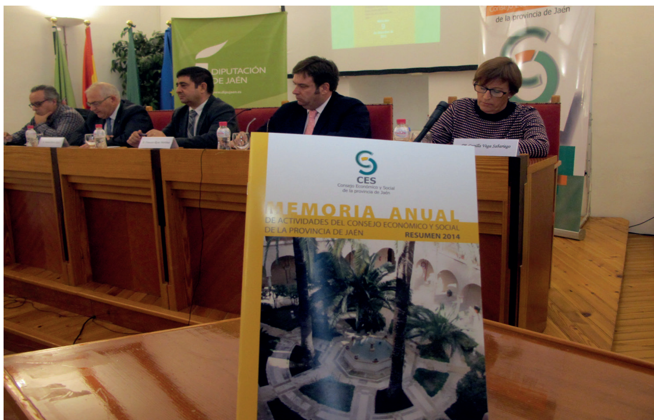
Acto de presentación de la Memoria sobre la situación socioeconómica y laboral de la provincia de Jaén el día 9 de diciembre de 2015

mos hecho un gran trabajo para la diversificación económica, el olivar sigue aportando mucho a nuestra economía y sus resultados adversos se han trasladado al resto de los sectores económicos". De esta publicación, el presidente de la Administración provincial ha resaltado que "refleja el hecho de que el empleo tiene que seguir siendo la gran prioridad para todos y todas las administraciones".